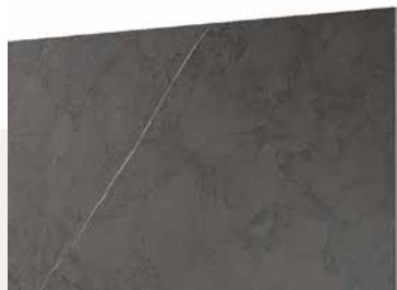
5156 Stone Dark