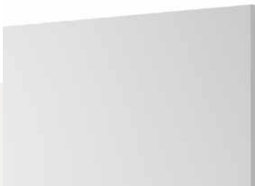
330 Basic White