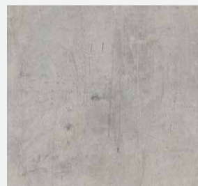
0427 MIXED GREY